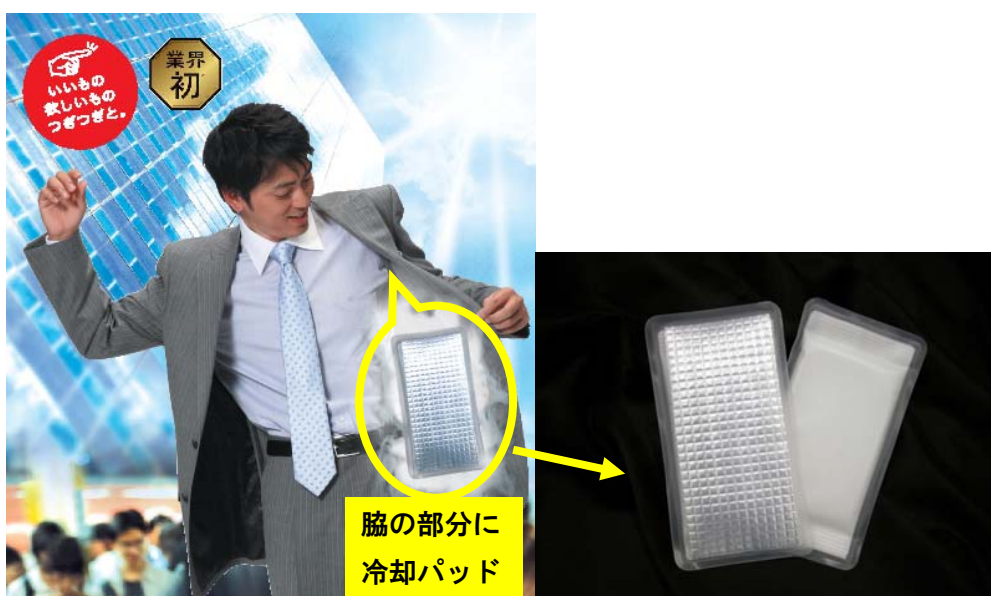
冷却パッド使用の新アイススーツ

この度発売する「新アイススーツ」は、モーターレースや消防服用などの冷却着衣や特殊防護服などの熱中症対策にも使われている冷却素材で、スーツの生地だけでは得られないパッシブな吸熱効果が得られるものです。当社が超薄型軽量化を図り、スーツ用に専用開発したクールパックをスーツの熱のこもりやすい両脇の部分に装着することで、スーツ内部の熱や体の熱を奪い、快適性・機動性を重視したものです。猛暑日や蒸し暑い夏または、自転車通勤などでスーツを着用するシーンで、体のほてりをクールダウンする業界初の冷房機能付の夏専用スーツです。