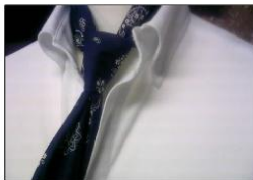
NG な着こなし、OK な着こなしとは？