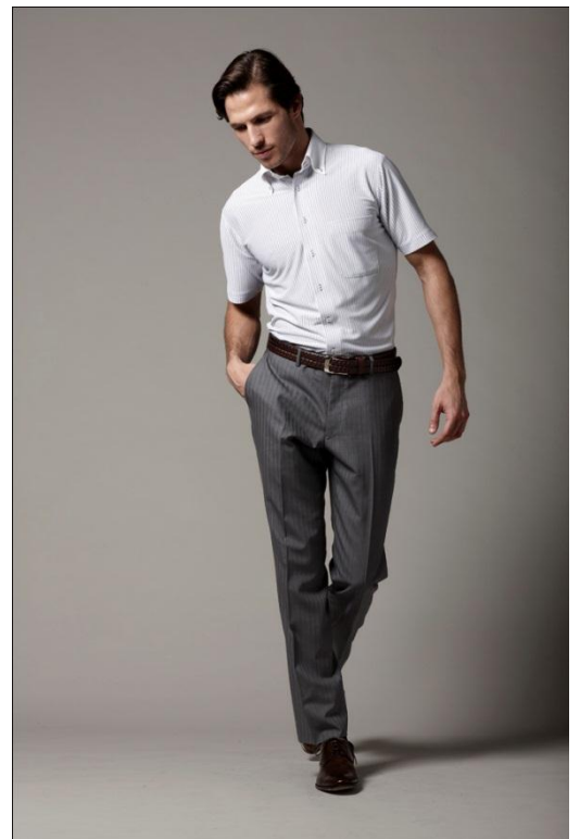
↑アイシャツ(半袖)着用写真

昨年は東日本大震災の影響による節電等で、当社でも既存のビジネスファッションにとらわれない商品を展開いたしました。しかしビジネスの上で商談・会議等でスーツやジャケットが必要であったビジネスシーンの実態を考慮し、今年は28°Cに設定されたオフィス環境下で、いかに快適に過ごせるかを考えたクールビズのトータルコーディネート提案していきます。第2弾として2012夏用アイシャツ(長袖・半袖)の販売を開始いたしました。