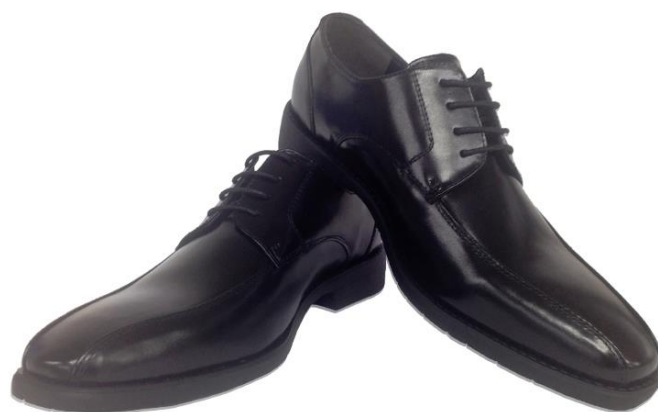
ストレートチップ ブラック