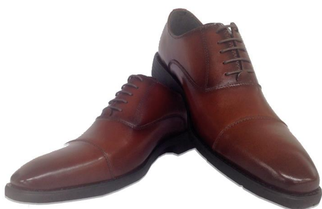
スワールモカ ブラウン