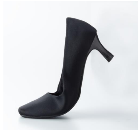
上：ニットによるストレッチ