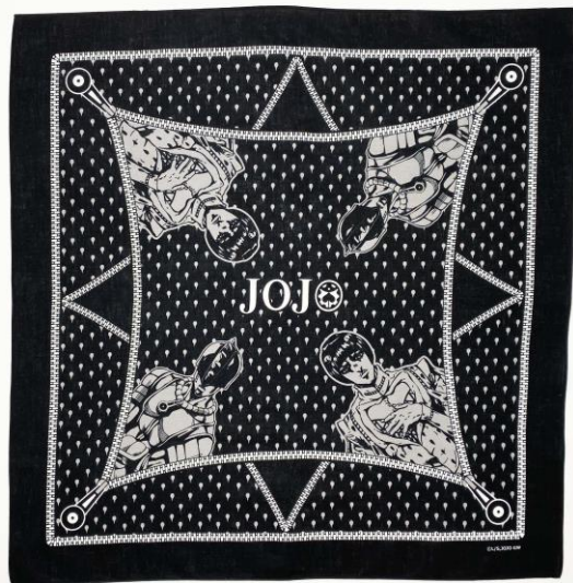
ブローノ・ブチャラティ