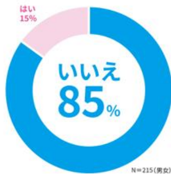
Q1.現在の学校に入学する前に抱いていた イメージ通りの学生生活を送れましたか？