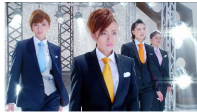
高橋さん： 男前になり来い