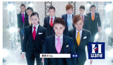
全員： フレッシュヤーズ はるやま